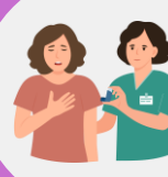
Pessoas com certas condições de saúde