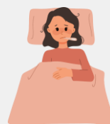
Fique em casa e evite a propagação