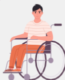
Pessoas com com deficiências