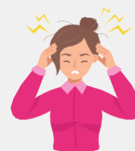
Dor de cabeça