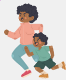
Bebés e crianças menores de 5 anos