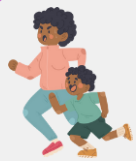
婴幼儿及 5 岁以下儿童