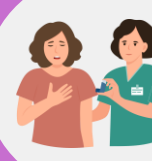
Люди с определенными заболеваниями