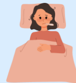
Zostań w domu i zapobiegaj rozprzestrzenianiu się chorób