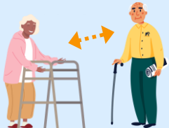
Giữ khoảng cách