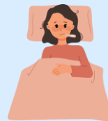
Ở nhà và tránh lây lan