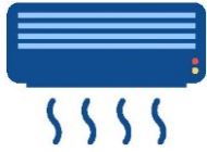
ស្នាក់នៅកន្លែងត្រជាក់។ ចំណាយពេលនៅក្នុងកន្លែងមានម៉ាស៊ីនត្រជាក់។